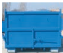
Klapka, panty nahoře + šrouby.

- Kontejnery jsou vyrobeny z uzavřených profilů 100 x 60 mm, opláštění je provedeno z plechu o síle 3 mm, dno kontejneru z plechu o síle 5 mm. Kontejnery mohou být vybaveny zadním sklopným čelem, nebo dvoukřídlými vraty s uzavíracím mechanismem. Použití vhodné především pro odvoz sypkých materiálů a pevných odpadů. Povrchová úprava je standardně řešena jedním základním a jedním vrchním nátěrem. V případě požadavku zákazníka je možné dodat kontejner v jiných rozměrech a provedeních.