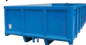
- Provedení na Tatra se spodním hřebem.