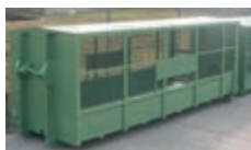
- Síťové provedení se sedlovou střechou.